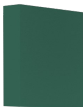
2FTR-ISO COARSE 65% (G4) 287X287X24 Code 13040