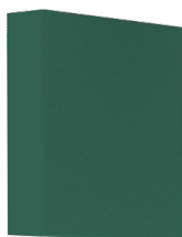
2FTR-H14 305X305X66 Code 13042